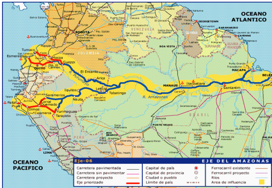
Figura ( 8):Eje multimodal amazónico . www.iirsa.org

Los ejes de integración dentro de la estrategia del IIRSA para que la Amazonia sea integrada de manera directa e indirecta, en los circuitos comerciales tanto de Sudamérica y de este con el resto del mundo son: 1: Eje Andino. 2. ) Eje Brasil –Bolivia. 3. ) Paraguay – Chile - Perú. 5.) Eje Venezuela-Brasil-Guyana-Surinam. 6). Eje multimodal Orinoco- Amazonas-Plata, Figura (8). 7. )Eje marítimo del atlántico. 8.). Eje multimodal pacífico. Eje Neuquen concepción. 9.). Eje Porto Alegre- Jujuy- Antofagasta. 10.) Eje Bolivia –Paraguay-Brasil. 11.). Eje Perú-Brasil, IIRSA (2004) 42 .