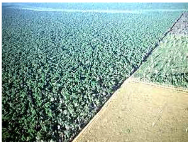
Figura (6): Deforestación del bosque amazónico