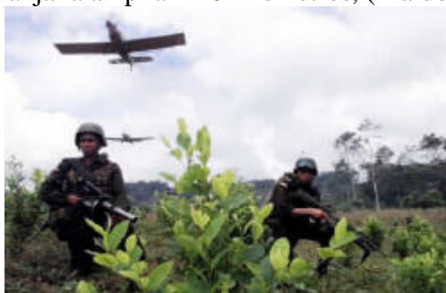
Figura (5): Fumigación química de las plantaciones de coca

Como es sabido las erradicaciones se ejecutan con las aplicaciones indiscriminadas de agentes químicos como el Roundap Ultra Plus y agentes biológicos modificados con sus consiguientes efectos adversos a los ecosistemas, afectando la salud de las diferentes especies que los habitan. Así por ejemplo, en los vegetales produce fitoestrógenos, en los mamíferos causa graves alteraciones de las funciones reproductivas con manifestaciones a nivel del sistema nervioso central, digestivo, gastrointestinal (destrucción de glóbulos rojos, náuseas, mareos, dolor de oído, ulceraciones de piel, problemas de visión, daños en hígado y riñones,... entre otras). Existen reportes que informan como el 100% de la población en la zona fronteriza entre Ecuador y Colombia ha sido intoxicada con las fumigaciones de Roundap Ultra en una franja de 5 kilómetros y el 89% si la franja la amplían 10 kilómetros, (Maldonado (2001:71) 31 .